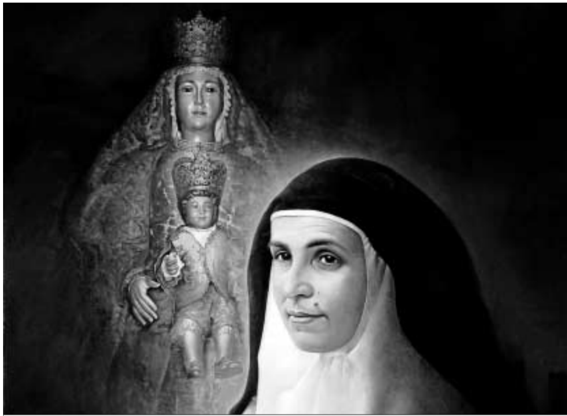
María de los Ángeles Guerrero González fue canonizada por el beato Juan Pablo II como Santa Ángela de la Cruz.